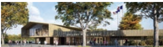
© COLDEFY & RELIEF architectures / VIZE

T. C : Outre le confort visuel et la sensation de bien-être qu'elle procure, une construction bois est un formidable matériau pédagogique. Elle montre qu'on peut agir à tous les niveaux pour diminuer notre impact sur l'environnement sans négliger le confort. Si les élèves se sentent bien dans ce collège où le bois est omniprésent, cela les incitera peut-être à utiliser plus de matériaux naturels dans leur vie d'adulte.